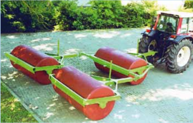
Koppelzug in Arbeitsstellung