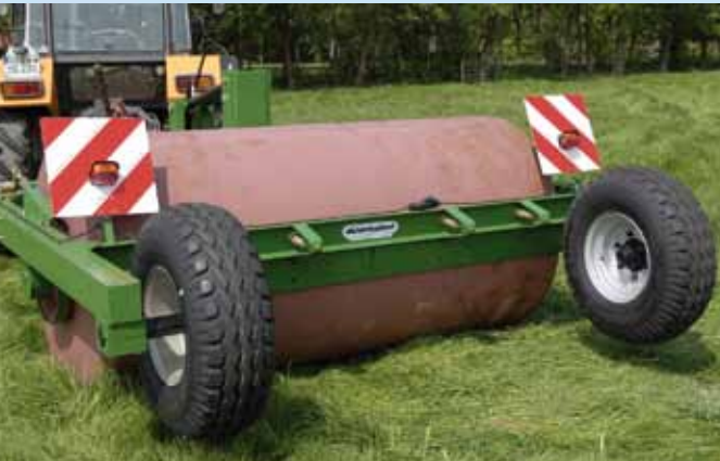
Wiesenwalze 2,50 m mit Fahrgestell in Arbeitsstellung