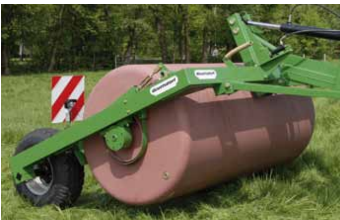
Wiesenwalze 2,50 m mit Fahrgestell in Transportstellung