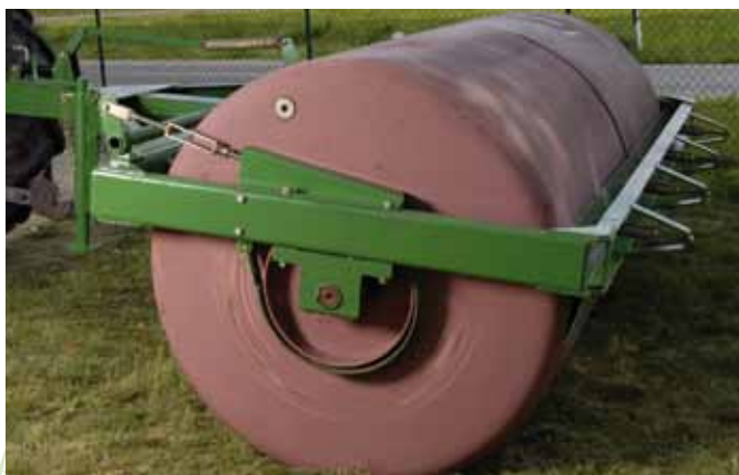
Heckansicht mit gefedertem Abstreifer