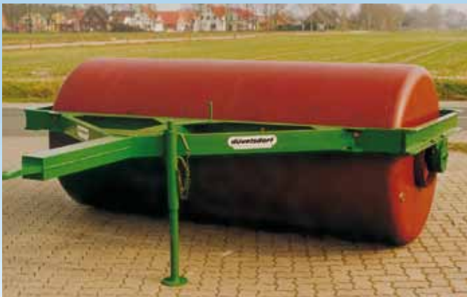
Einzelwalze 2,75 m