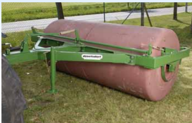
2-teilige Walze 2,75 m mit Bandbremse